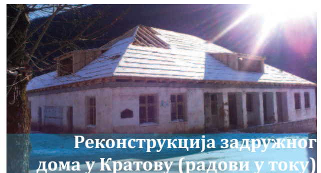
Реконструкција задружног дома у Кратову (радови у току)