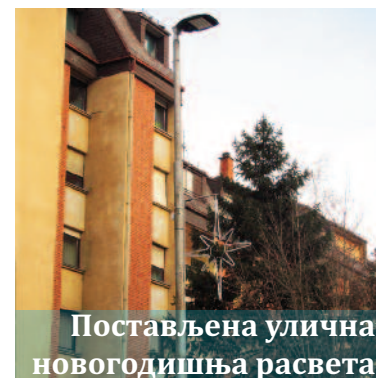
Постављена улична новогодишња расвета