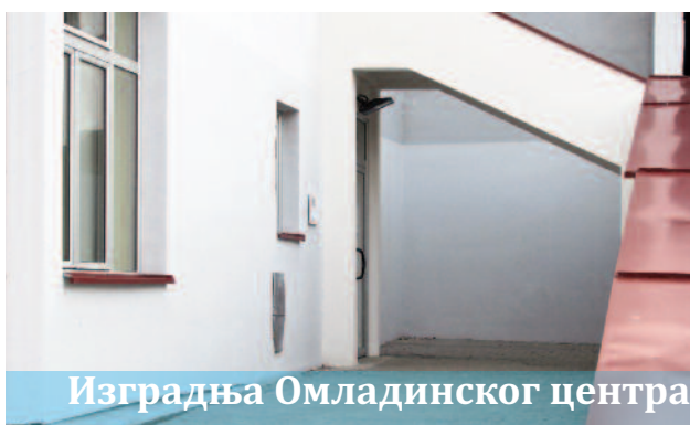
Изградња Омладинског центра