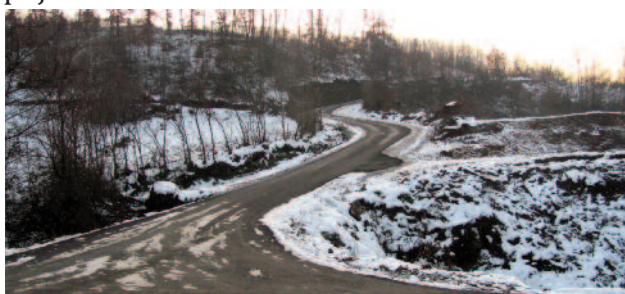
Пут Прибојска бања - Манастир Увац

жине 12 km у више месних заједница и насеља (Потпећ - Караџићи, Јелача, Хер Голеша - Жарковићи, Мишковац, Рабреновац, Зеленац, Лаптошко поље - Шалипури, Расадник - Чаушевићи); - Изградња 11 монтажних кућа за прогнана лица;