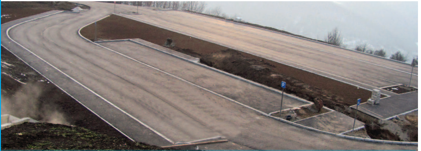
Изградња паркинга на Прибојској бањи