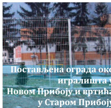
Постављена ограда око игралишта у Новом Прибоју и вртића у Старом Прибоју