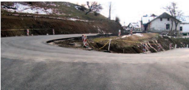
Реконструкција кривине пута Прибој – Кокин Брод