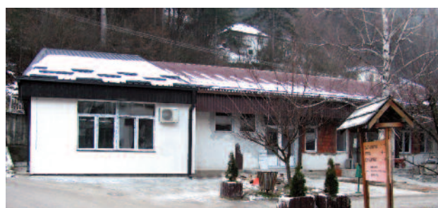
Изградња одељења за дијализу у оквиру Болнице Прибоја