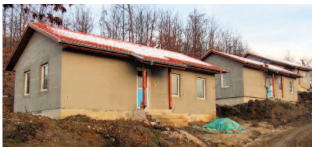
Изградња 9 монтажних кућа за лица угрожена клизиштима