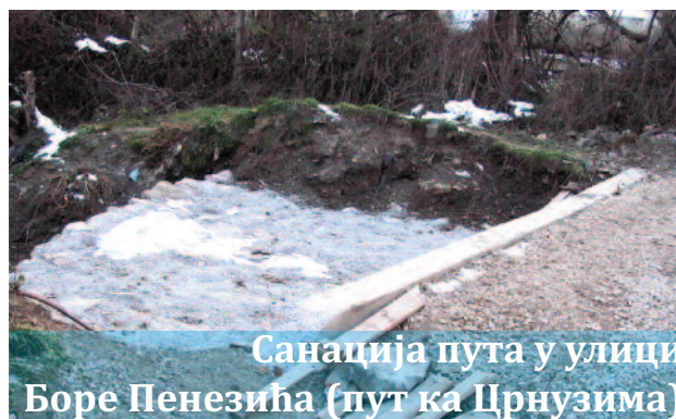
Санација пута у улици Боре Пенезића (пут ка Црнuzима)

- Ојачање коловозне конструкције укупне ду-