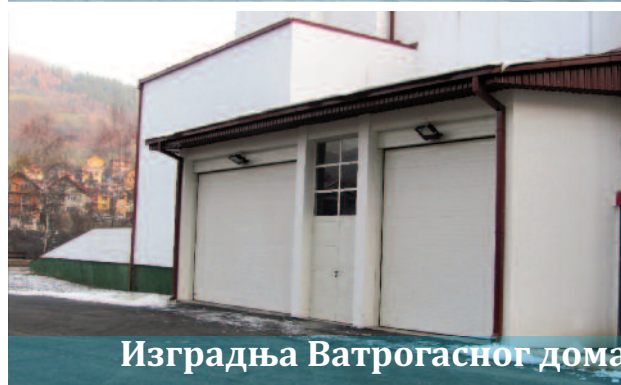
Изградња Ватрогасног дома