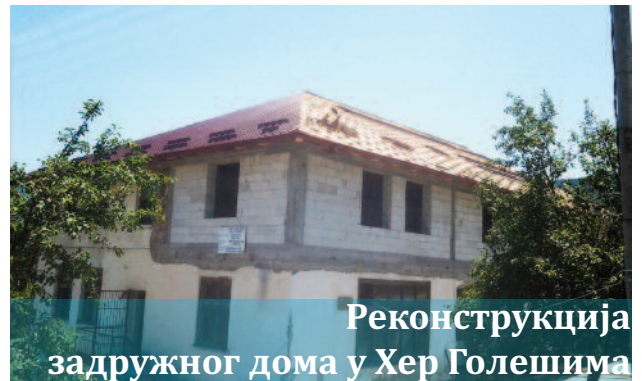
Реконструкција задружног дома у Хер Голешима