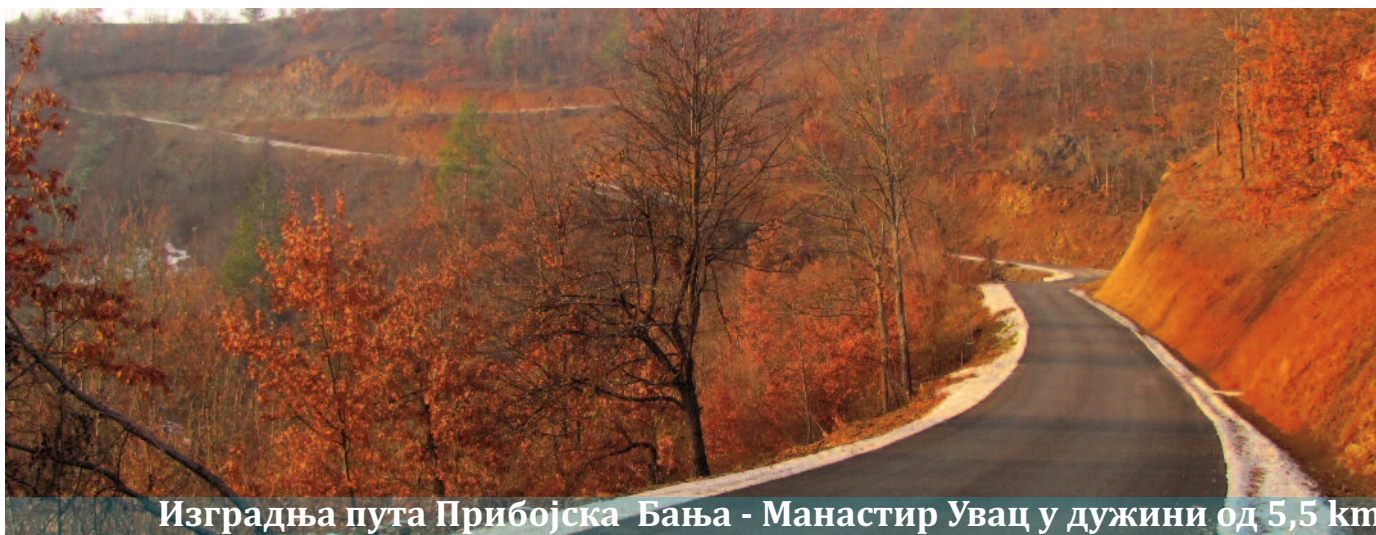
Изградња пута Прибојска Бања - Манастир Увац у дужини од 5,5 km