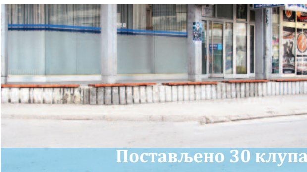
Постављено 30 клупа