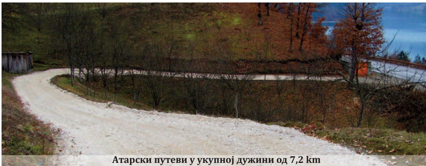
Атарски путеви у укупној дужини од 7,2 km