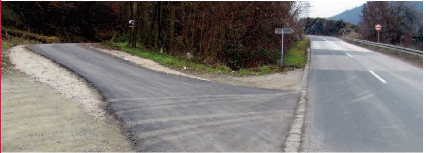
Асфалтирање путних праваца у више месних заједница укупне дужине 17 km