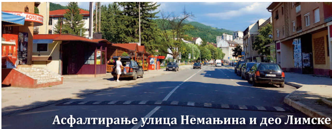
Асфалтирање улица Немањина и део Лимске