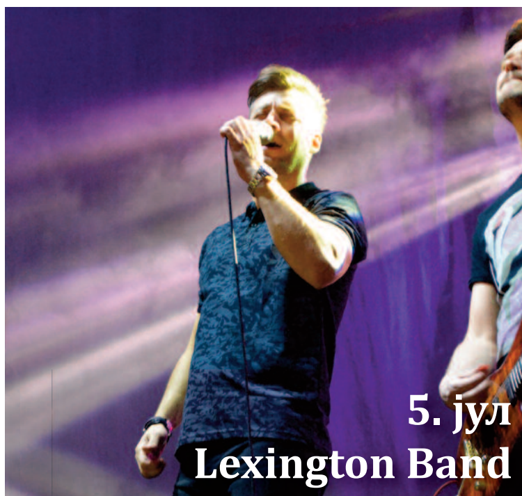
5. јул Lexington Band